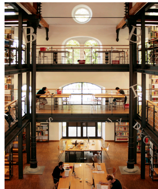
Bibliothek der HTWG Konstanz

Die Hochschule Konstanz Technik, Wirtschaft und Gestaltung (HTWG) ist eine moderne Hochschule mit einem anwendungsorientierten Profil. Sie verfügt über ein breites Fächerspektrum und profitiert von der Interdisziplinarität sowie der Verbindung von Theorie und Praxis. Die Hochschule ist in Forschung und Entwicklung, Technologietransfer und Weiterbildung Partner für innovationsorientierte Unternehmen und leistungsbereite, kreative Menschen. Sie ist ein wesentlicher Teil der internationalen Wissenschafts- und Wirtschaftsregion Bodensee. Kernanliegen ist es, engagierten Talenten unterschiedlicher Vorbildung Berufs- und Lebenschancen zu eröffnen.