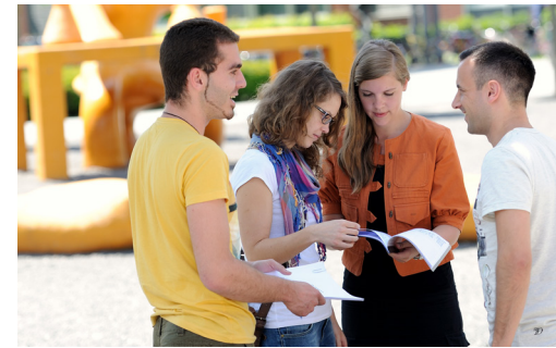
Oben: Die Studenten der Hochschule Konstanz geben ein durchweg positives Feedback zum leistungsfähigen und hochverfügbaren Campus-WLAN